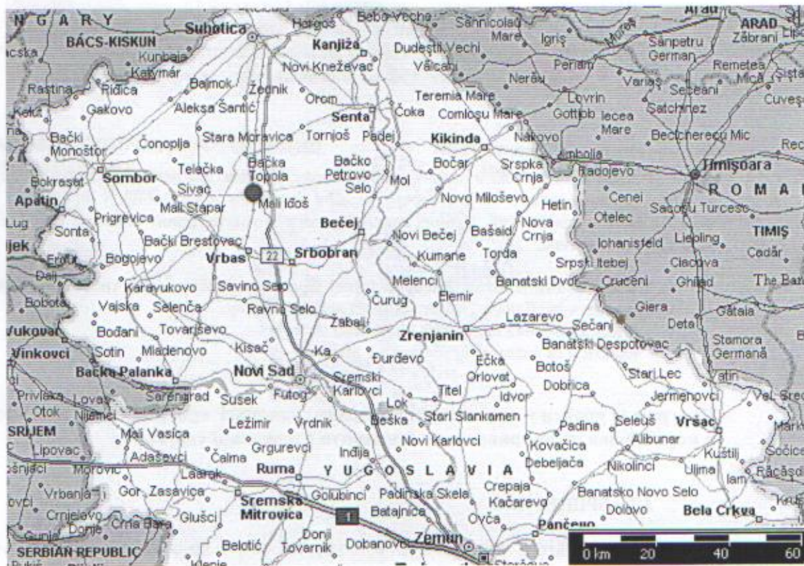
Сл.1 Географски положај општине Мали Иђош